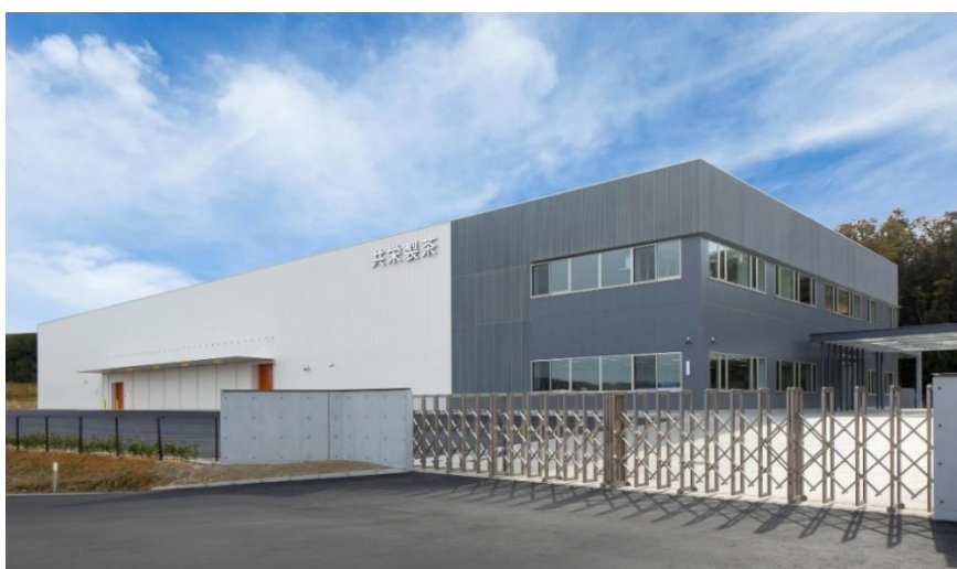
（京都テクノセンター 全体写真）

同センターは、既に有機認証・ハラール認証を取得しており、このFSSC22000の取組みが加わることで、より安全な商品創りを進め、国内外のお客様のご期待に添えるよう、安全と品質の向上に向けた取組みにむけて邁進して参ります。