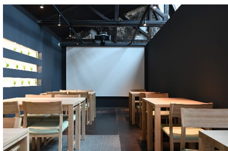
新茶ハーバリウムやお茶の映像 上映を楽しめるサロンスペース