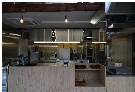
菓子工房でつくる抹茶スイーツやほう じ茶スイーツはテイクアウト可能