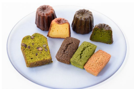
菓子工房で作る抹茶やほうじ茶をふん だんに使ったスイーツ類

「TEA SQUARE MORIHAN」ではお茶と共に味わっていただけるよう、隣接した工場 で製造した抹茶やほうじ茶をふんだんに使ったスイーツ、ドリンクを提供します。スイ ーツは「TEA SQUARE MORIHAN」内に新設した菓子工房内で作る出来立てです。