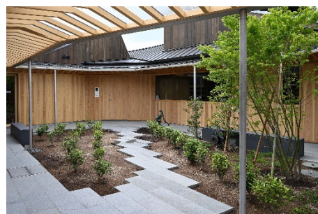
茶の木を植えた中庭