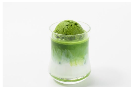
挽き立ての高品質な抹茶を使った抹茶 ラテフロート